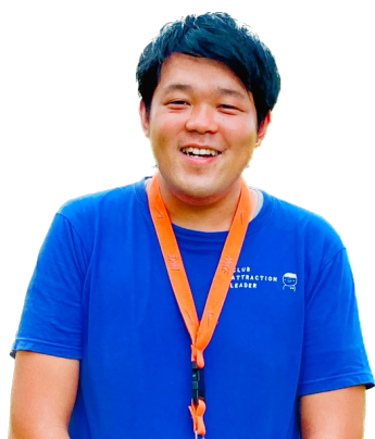
クラブ アトラクション たなか よういち @うーたん

この度は、当団体のキャンプにご参加いただきましてありがとうございます。この夏のミッションとして「この感動がきっといつかの自分を強くする」ということを大切にしてもらいたいと考えています。今回、参加されるお子さんの中には1人で参加するお子さんも、友達やきょうだいで参加されるお子さんも多くおられます。みんなが次々につながり、仲間が増えて、仲間になったからこそできることが増え、みんなでできたを共有・共感そして実感できる2日間になればと思います。そしてその過程で生まれる感動がきっといつかの自分を強くしてくれる原体験になればと考えています。今後の生活の中でも、キャンプを境目に「何か姿勢が変わったよ」という変化を保護者さんにも伝わるように私たちも様々な仕掛けをしていきます。最後に、私たち指導者やリーダーが率先して、どうやったらできるのか常に挑戦し続けることをこどもたちに見せながら、一緒に挑戦する2日間にしたいと考えております。保護者の皆様も、引き続き見守っていただければ幸いです。本年より職員が増員され、私もはじめてずっと現場におらず、担当する職員が引率させていただきます。すべての参加者の皆さまやご家族が安全に安心して楽しく体験できるように、出発までも含めて私もサポートさせていただきます。